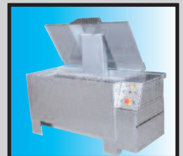
Hubtauch Super Wave