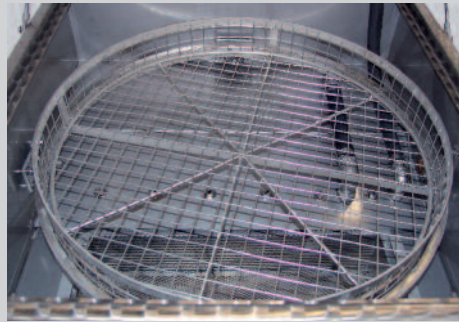
Abb. Robuster Edelstahl-Waschkorb, motorisch angetrieben